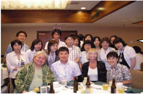
ハレホスタッフを交えての夕食会

ハレホ施設は自費です。 費用が高いので米国では在宅患者が多いのです。 日系の利用者が多いので日本語はなせるスタッフがいることがアピールになる。