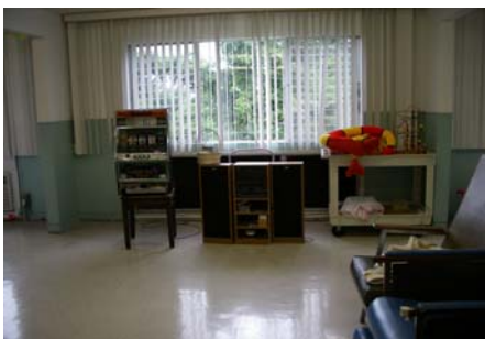
ディルームにスロット発見！！