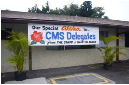
IMG グループの施設でした