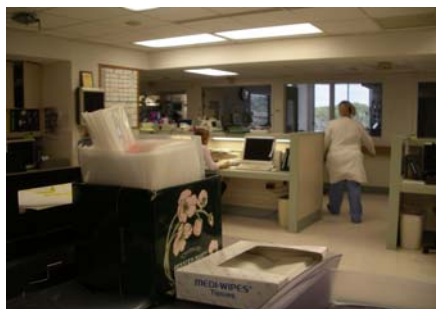
ナースステーション