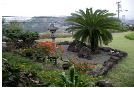
日系の入所者も多いので日本庭園風