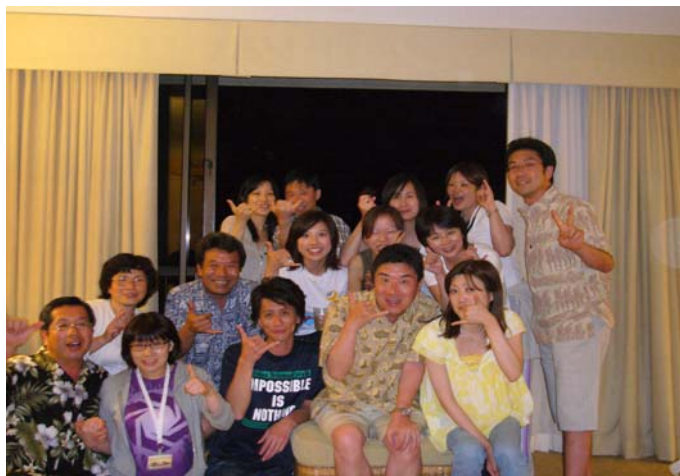
最後の夜、皆で飲みました。仲良くなれました