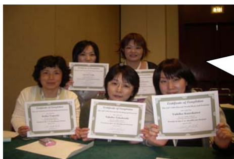
約2時間の講義でした

受講終了書もらいました。 日本語の講義でよかった～ 米国の看護師はボーナスないらしい