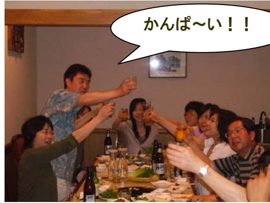
なぜか焼肉食べ行った