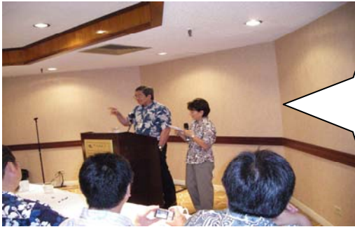
ホテルに戻ってハレホスタッフを交えてディスカッション

ハレホ施設は自費です。 費用が高いので米国では在宅患者が多いのです。 日系の利用者が多いので日本語はなせるスタッフがいることがアピールになる。