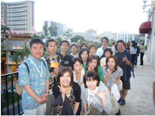
これからマジックショー見に行きます