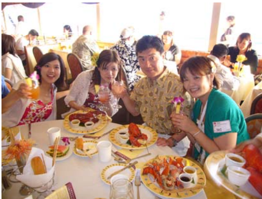
サンセットディナークルージング