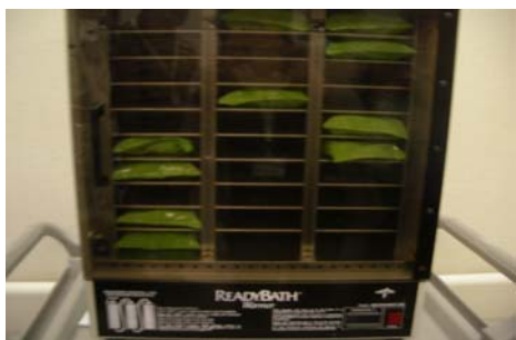
清拭タオルが入ってる