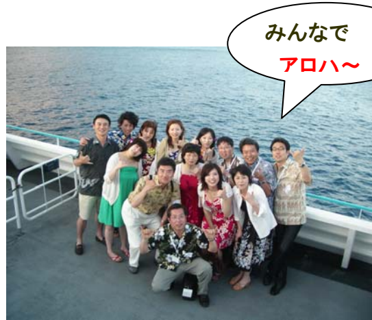
アロハシャツ&ムームーで合わせました